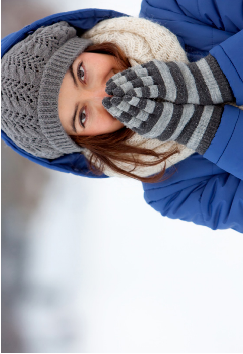
हिउंद (जाडो) मौसम