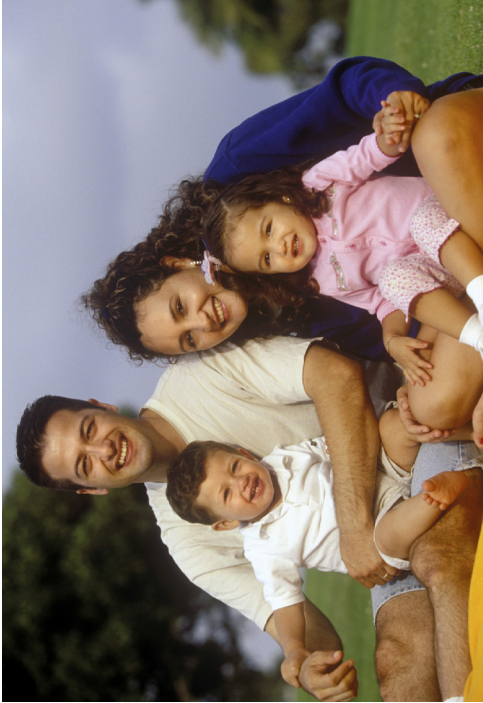
गर्मी (गृष्म) मौसम