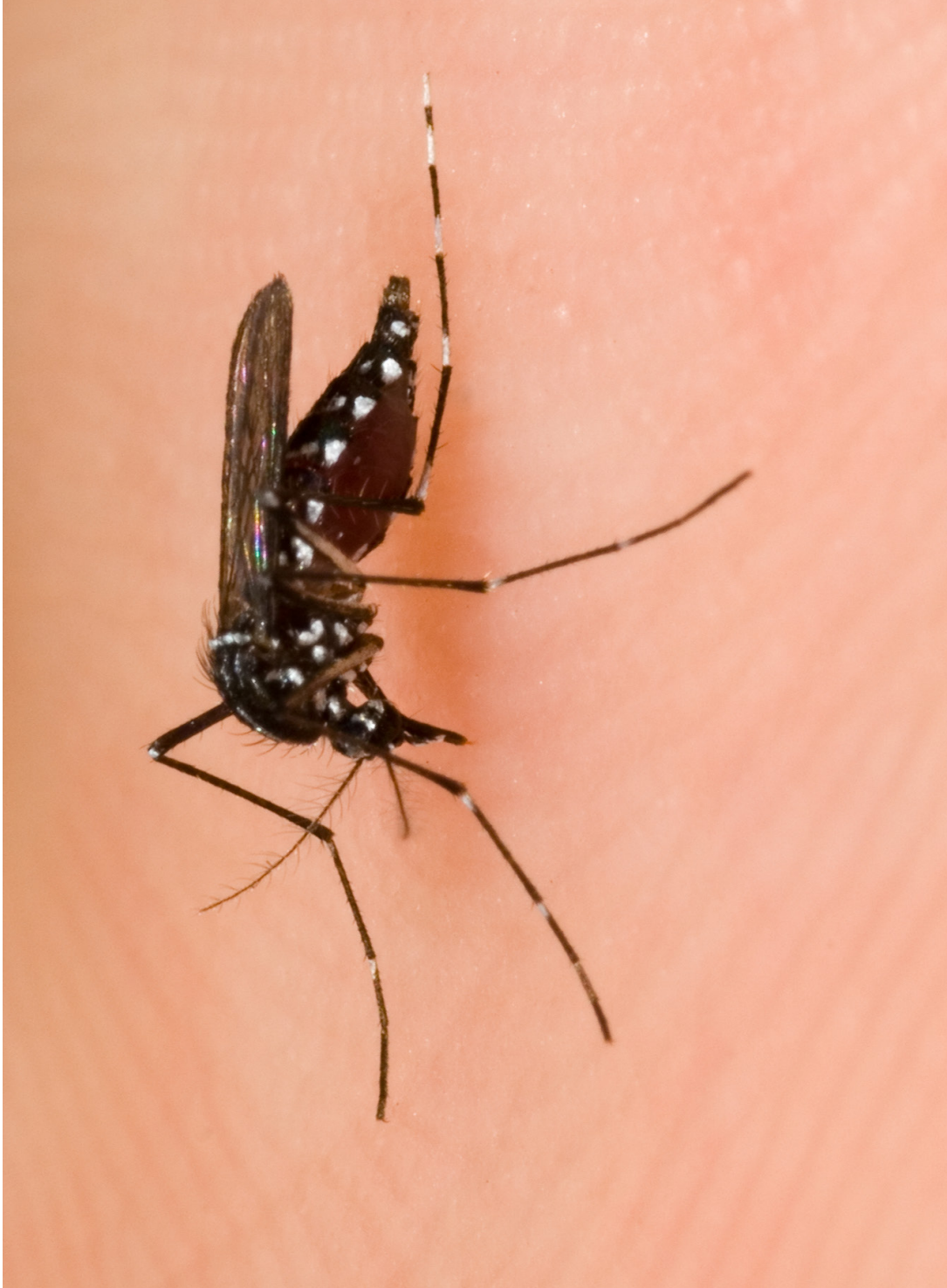
एउटा किराले तपाईंलाई टोकेको छ ।