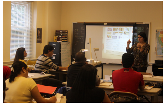
अंग्रेजी भाषाको सिकाई