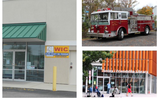
सामुदायिक सेवाहरु तथा सार्वजनिक सहयोग