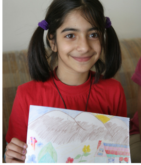
बालबालिका तथा युवा