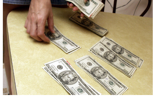
आय-व्यय तथा व्यक्तिगत पूँजीको व्यवस्था गर्दा