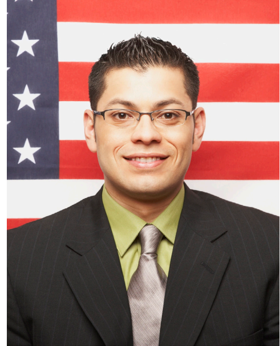
अधिकार तथा कर्तव्यहरु