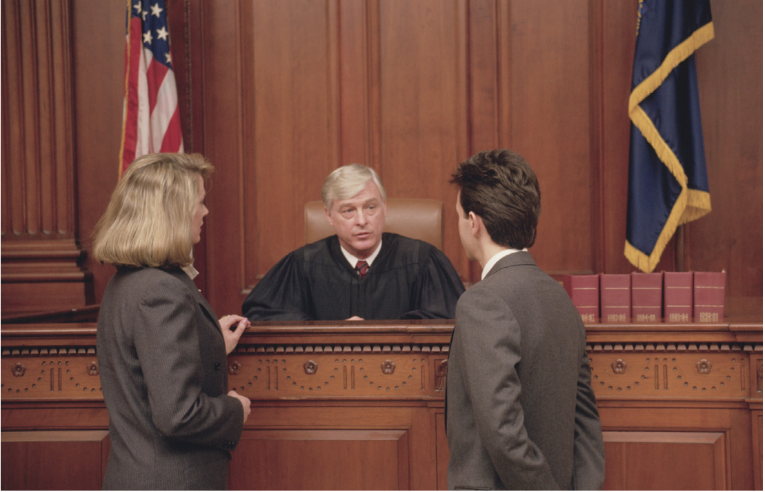
संयुक्त राज्य अमेरिकाका कानूनहरु