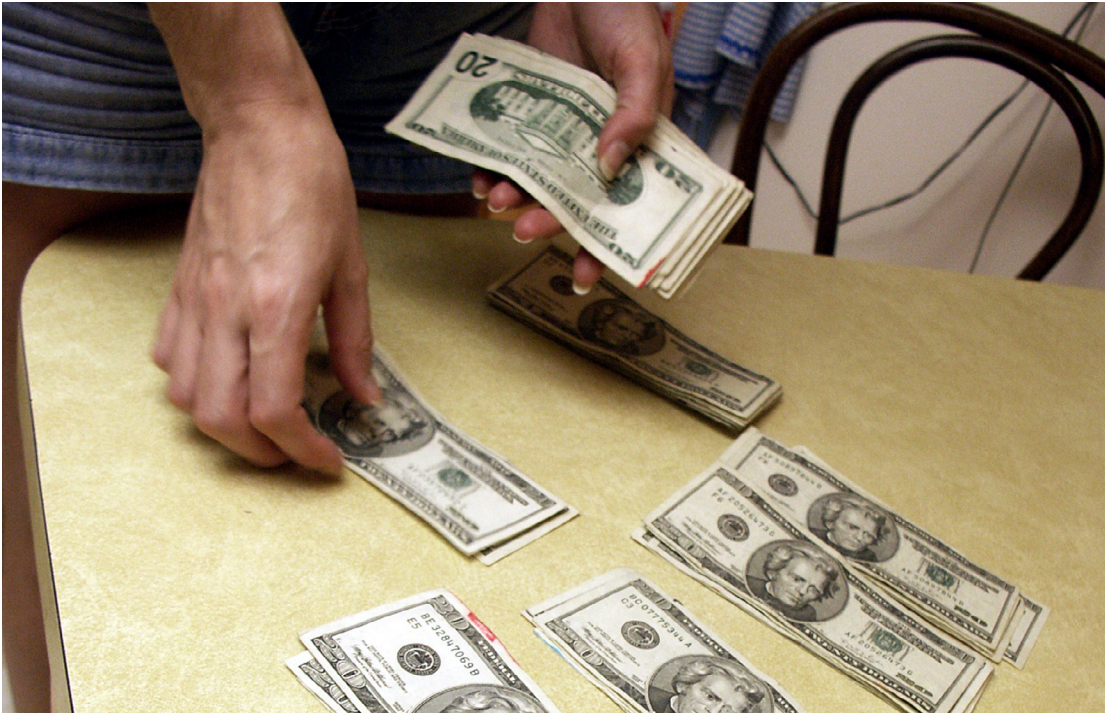
आय-व्यय तथा व्यक्तिगत पूँजीको व्यवस्था गर्दा