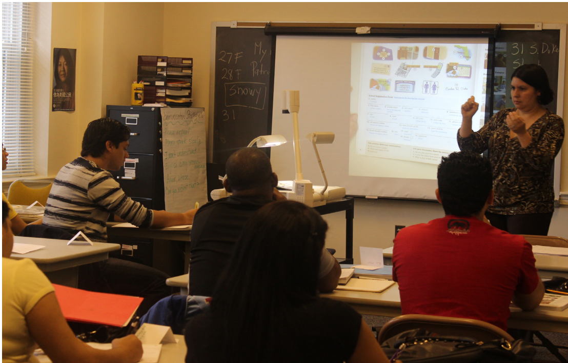
अंग्रेजी भाषाको सिकाई