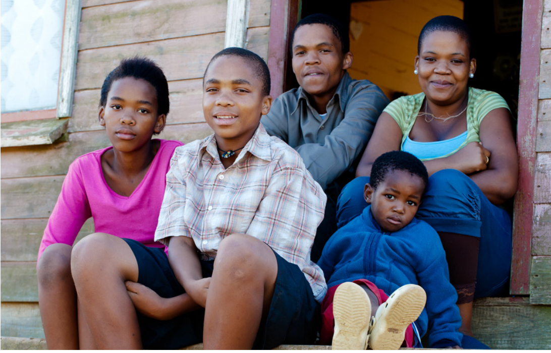
परिवार तथा मातापिताद्वारा लालनपालन