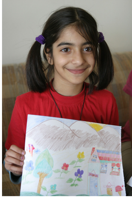
बालबालिका तथा युवा