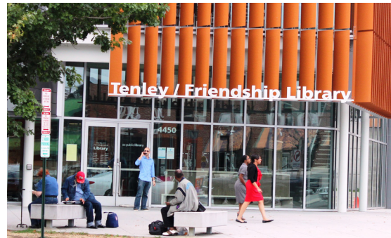
सामुदायिक सेवाहरु तथा सार्वजनिक सहयोग