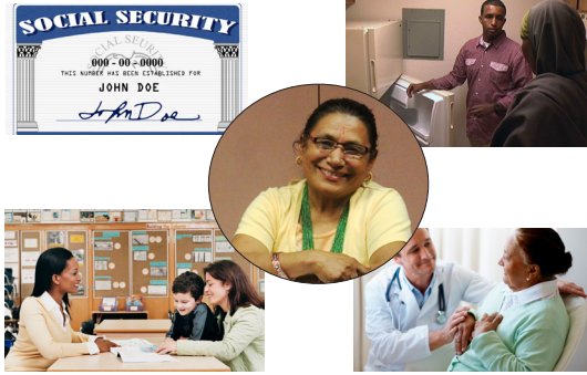
पुनर्वास संस्थाको भूमिका