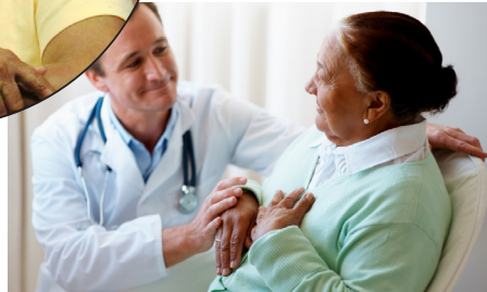
पुनर्वास संस्थाको भूमिका