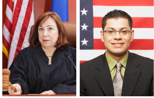
अधिकार तथा कर्तव्यहरु