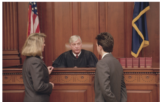
संयुक्त राज्य अमेरिकाका कानूनहरु