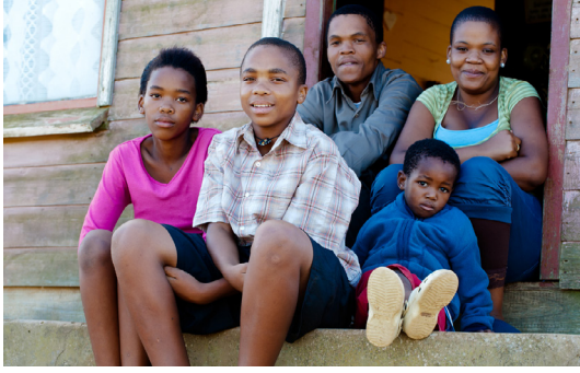
परिवार तथा मातापिताद्वारा लालनपालन