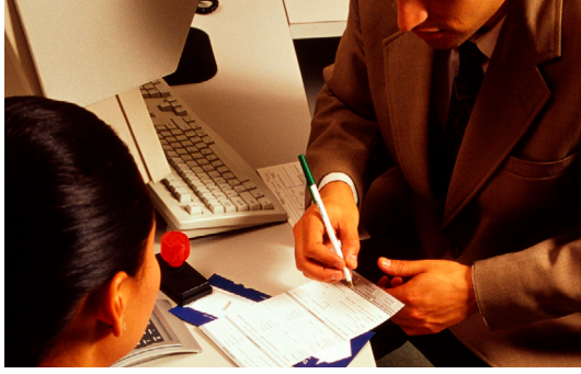
शरणार्थी स्तरमा आफूलाई समायोजन गर्दा