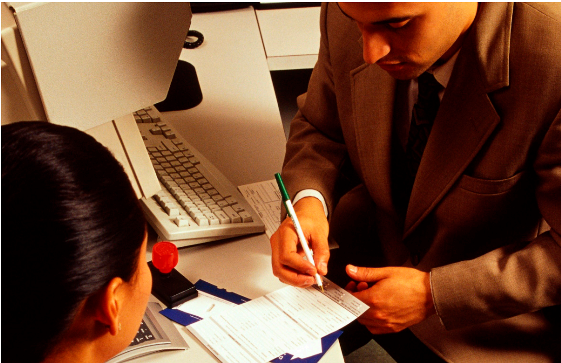
शरणार्थी स्तरमा आफूलाई समायोजन गर्दा