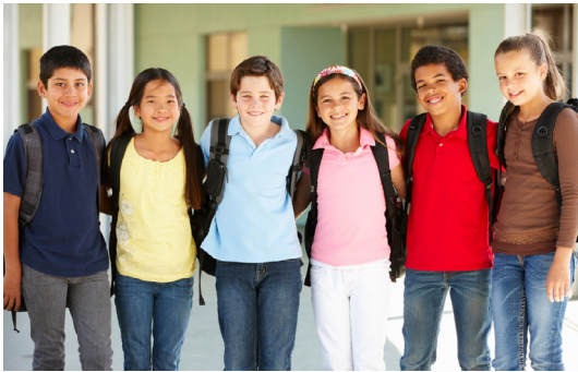
माध्यमिक स्तर (K-12) को शिक्षा